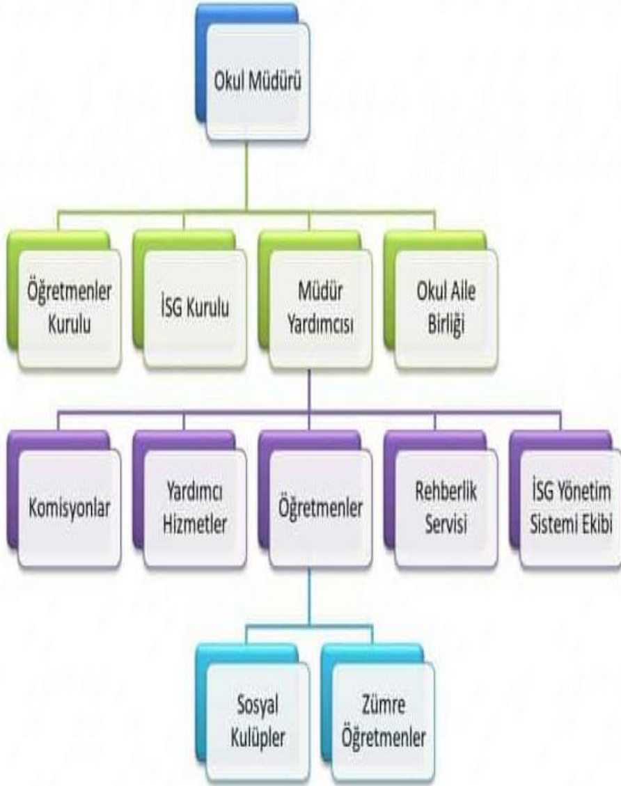
Şekil 1. Organizasyon Şeması